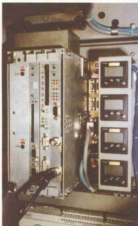
Simatic S5-kompatibel im VMEbus steuern: Die Integration der SPS in die VMEbus-Steuerung erbrachte eine überdurchschnittliche Reduzierung der Hardwarekosten. Im Vergleich zu herkömmlichen Lösungen um bis zu 40 Prozent.

Da zeitaufwendige Kommunikationsbeziehungen durch die direkte VMEbus-Kopplung von SPS und VME-CPU entfallen und beide CPUs auf den gemeinsamen E/A-Bereich zugreifen, ergeben sich insgesamt kürzere Reaktionszeiten der Steuerung. Die Programme wurden kürzer und damit übersichtlicher gestaltet und eine durchgängige Diagnose durch übergeordnete Leitsysteme ist nunmehr problemlos realisierbar. Die jeweilige Software-Version kann dabei per Fernabfrage festgestellt werden. (rbs)